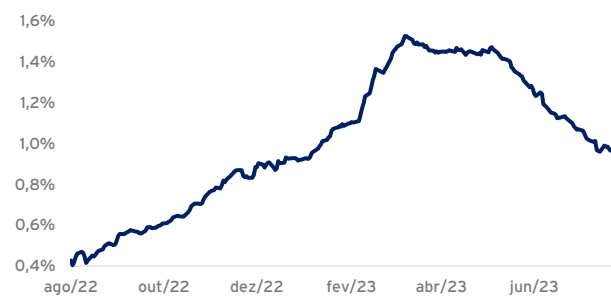
Spread de Crédito das Debêntures Incentivadas (a.a.)

Ainda que os últimos 3 meses tenham trazido retornos expressivos para os fundos de debêntures incentivadas, acreditamos que ainda estamos em uma janela de entrada interessante, com mais espaço para fechamento. O gráfico abaixo mostra o movimento dos spreads de crédito nos últimos 12 meses: