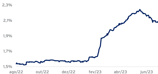
Spread de Crédito das Debêntures, em CDI+ (a.a.)

Observamos um fluxo comprador mais forte, sobretudo no final do mês, e por isso o resultado dos fundos veio ainda melhor que no mês passado, que já tinha sido surpreendido. Ou seja, como havíamos sinalizado nos meses mais desafiadores, os fluxos no mercado de crédito high grade é um fator importante para definir o nível dos prêmios de crédito, muitas vezes até mais que o fundamento dos emissores. Portanto, com a demanda crescente, esperamos continuar vendo bons resultados em nossas estratégias. O gráfico abaixo ilustra o comportamento do spread de crédito no ano: